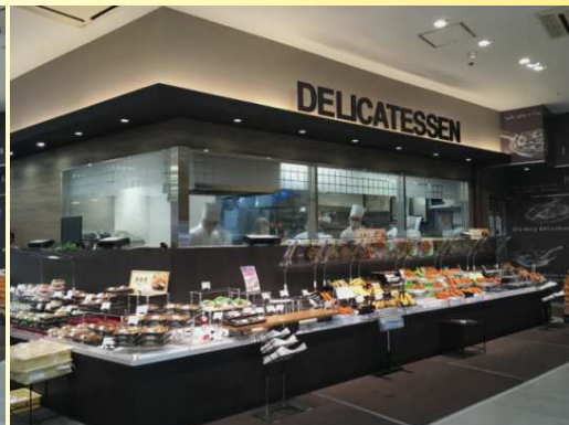
東急ストア 五反田店 様